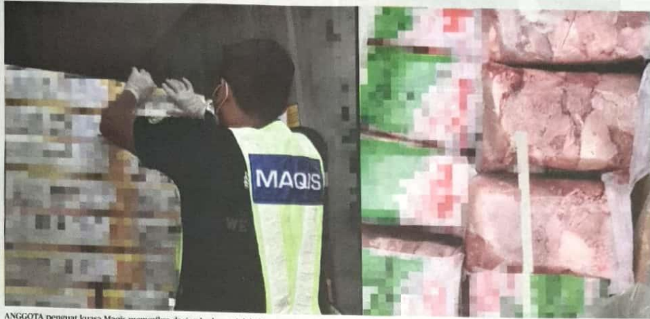
ANGGOTA penguat kuasa Maqis memeriksa daging kerbau sejuk beku yang dirampas.