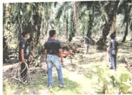
ANGGOTA MDKS menangkap lembu yang dibiarkan berkeliaran oleh pemiliknya di Kuala Selangor kelmarin.

Menurut Jefrie, operasi itu akan dilakukan secara berterusan bagi memastikan penternak supaya lebih bertanggungjawab.