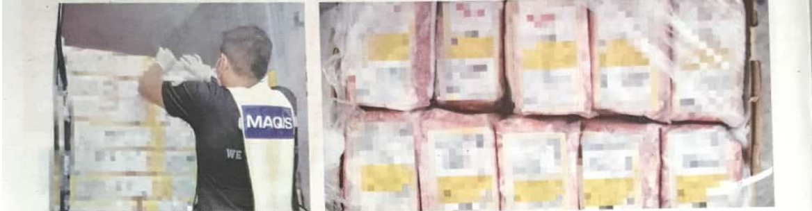
SEORANG penguat kuasa Maqis memeriksa daging kerbau bernilai RM4.2 juta di NBCT Seberang Perai.